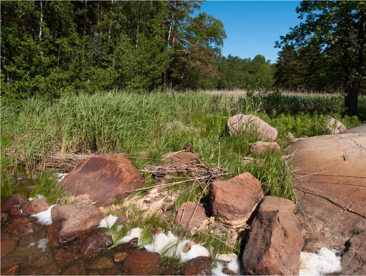
Figur 4. Utflöde med våtmarken i bakgrunden.