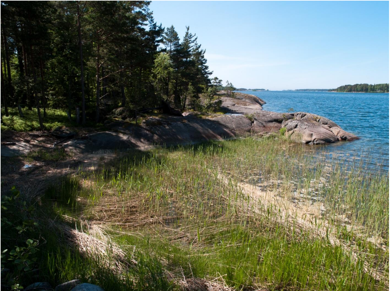
Strandpartiet i figur 3.