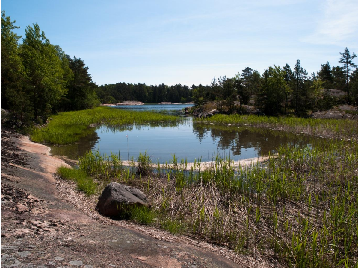
Figur 5 sedd från vikbotten utåt.