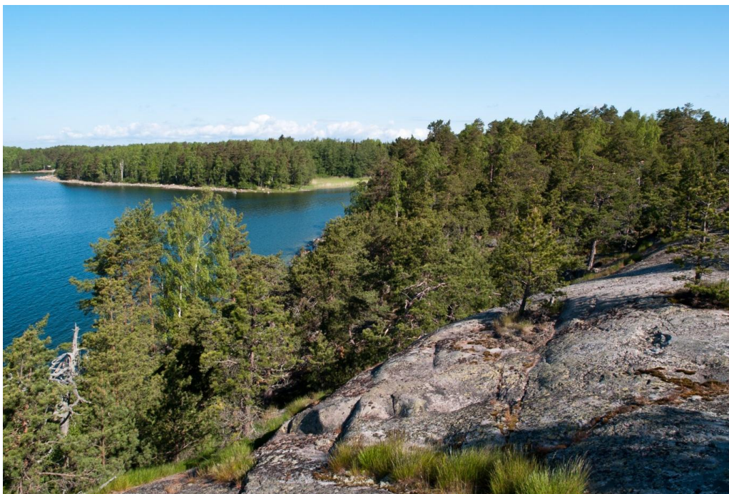
Figur 2 gränsande till figur 1 (till höger på bilden). Fotograferad mot norr