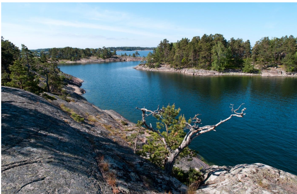
Figur 2 södra delen med de små holmarna strax utanför.