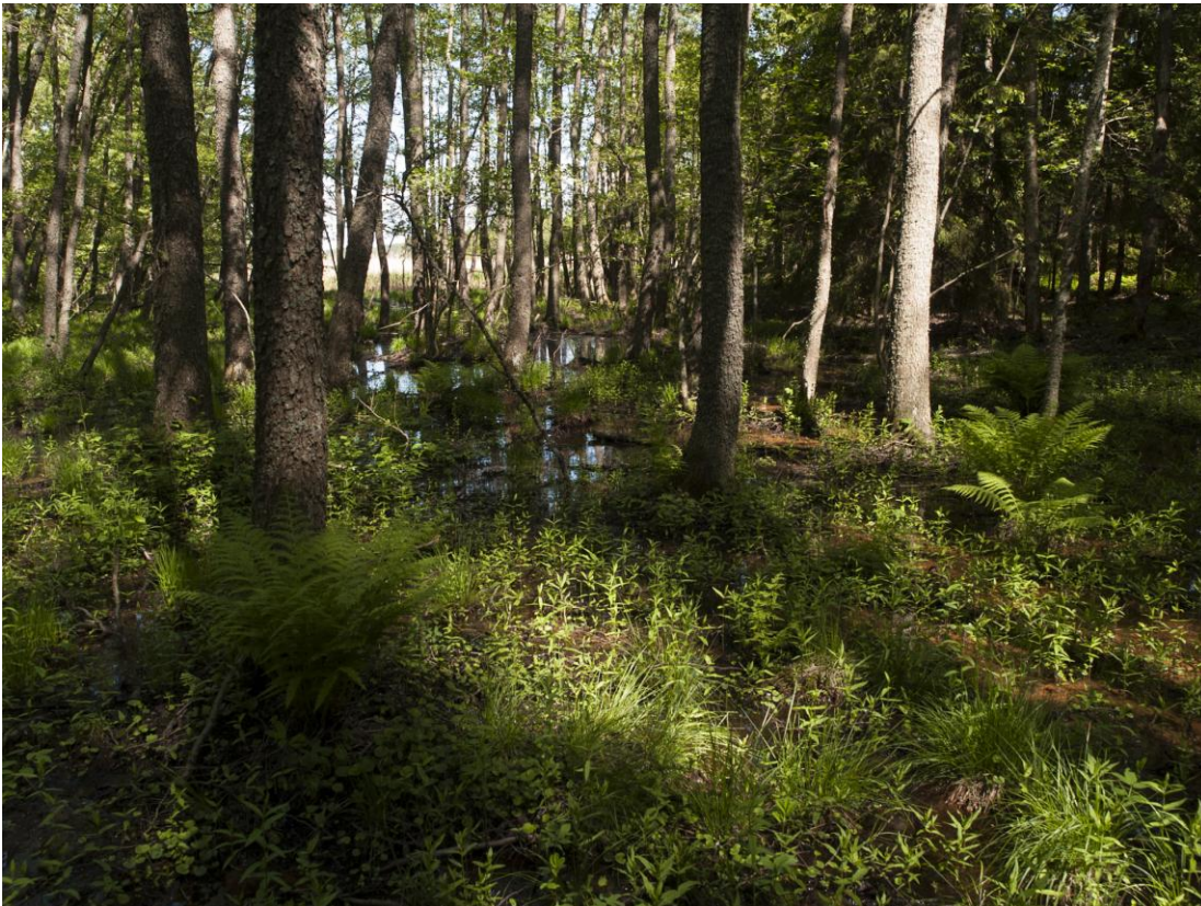
Figur 8. Alkärr.